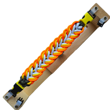
A képen TULIP fonat látható